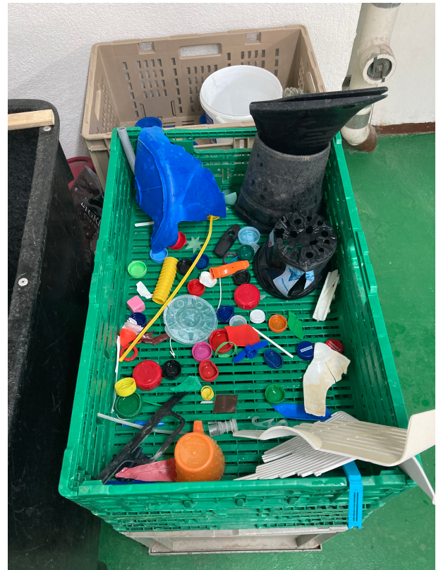
Nach einer Einweichzeit von 12 Stunden werden die Objekte von Hand gebürstet und zum Trocknen ausgelegt.

Sobald die Objekte identifiziert und sortiert sind, müssen sie gereinigt werden, bevor eine Umwandlung erfolgen kann. PPL verwendete eine Kombination aus Backpulver und Essig mit Wasser, um Schlamm und Schmutz von den an Gewässern gesammelten Objekten zu entfernen.