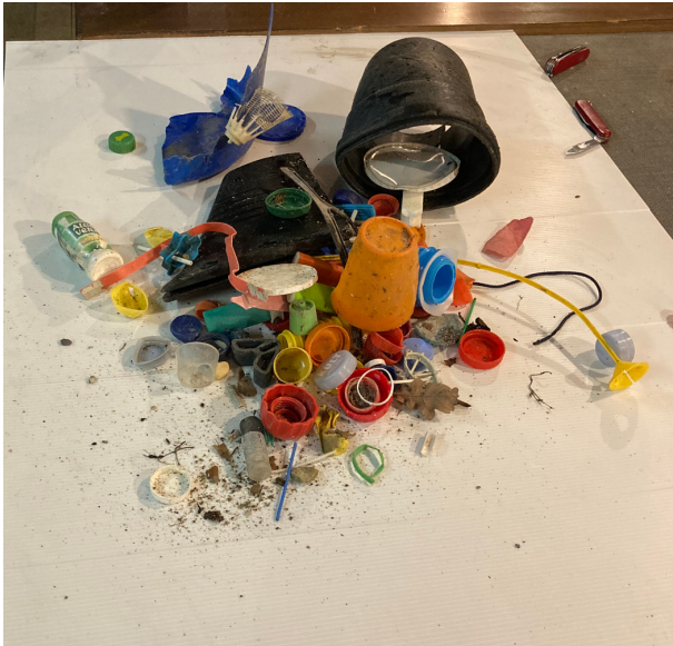
Bei der Probenahme gesammelte Objekte