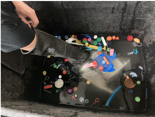
Probenmaterial schrubbten und einweichen